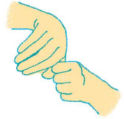
8. 回しながらあらってね