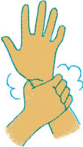
13. さいごは手首をあらって