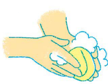
2. せっけんを泡立てよう