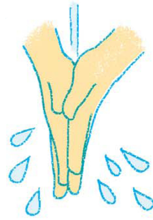
15. よくすすぎハンカチでふいて