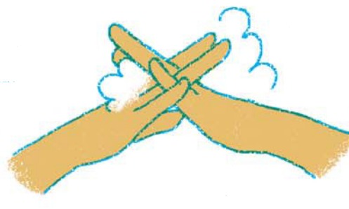
11. つぎは指のあいだだよ