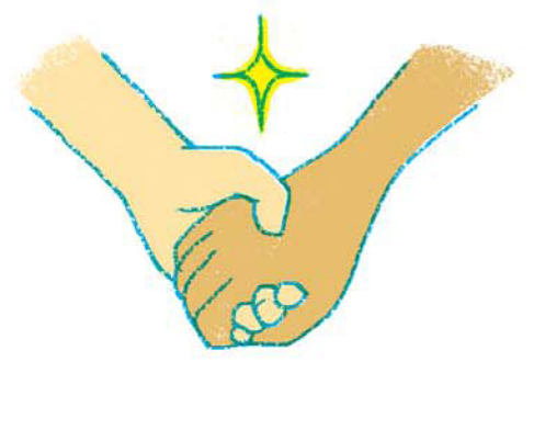
16. みんなで手をつなごう