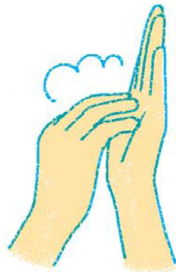
5. つめを手のひらでこすって