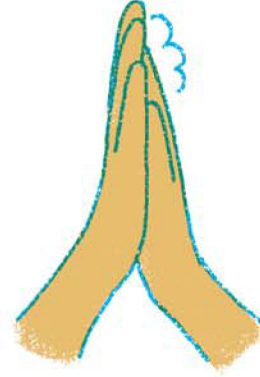
3. 手のひらをこすりあわせて